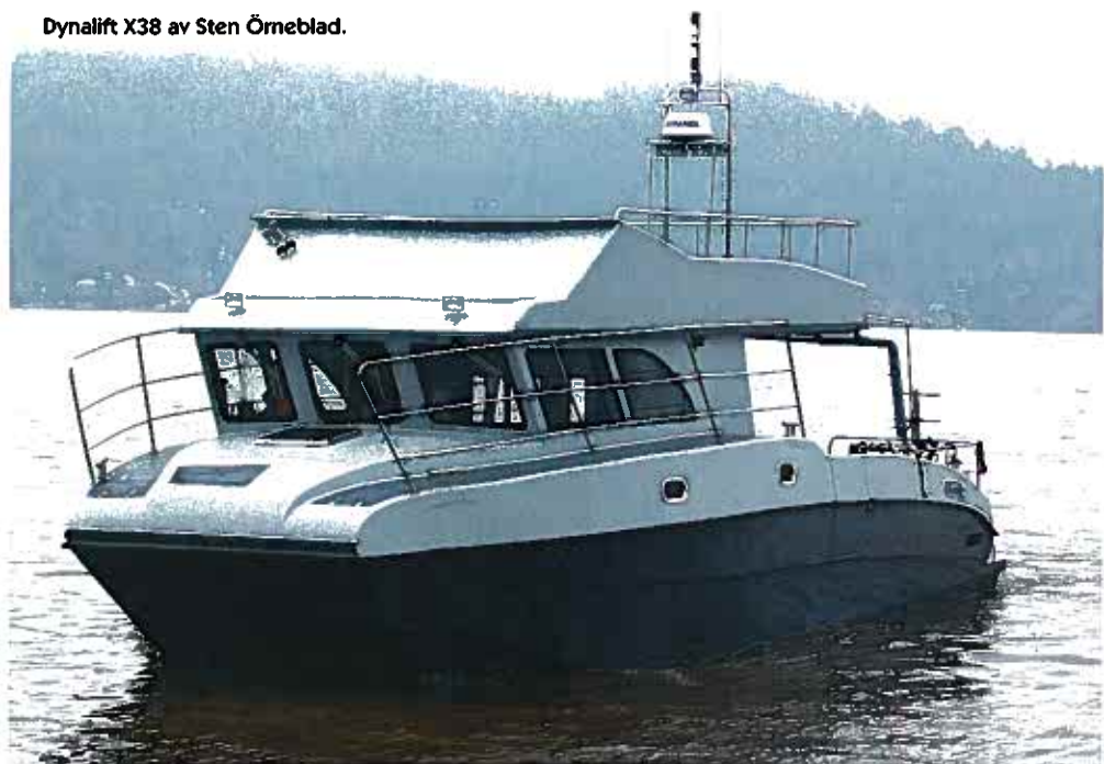
Dynalift X38 av Sten Örneblad.

FAKTA: DYNALIFT X38 LÄNGD: 11,5 meter BREDD 4,95 meter DJUP: 0,8 m (med motorer) BRÄNSLETANK: 2 x 500 liter PRIS: ca 3 600 000 kronor DESIGN: Sten Örneblad MER INFO: www.marinedynamics.us