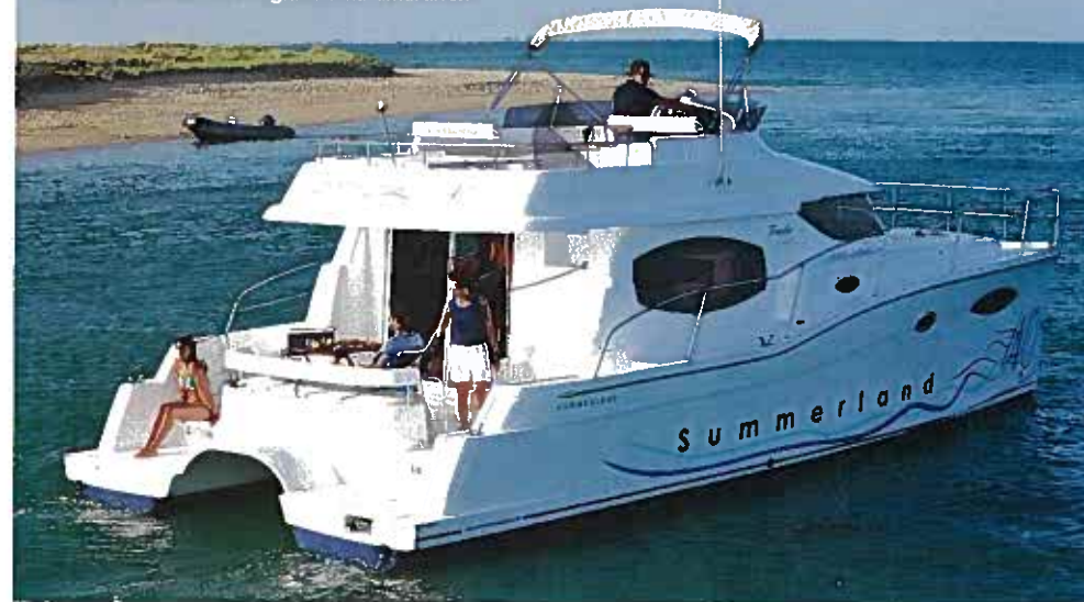
Summerland 40 är en cruisingkatamaran från designgruppen Fountaine-Pajot som i vanliga fall bland annat ritat seglande katamaraner.

Summerland är semide-placerande. Marschfarten är