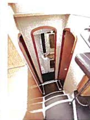
Utrymmena i en katamaran upplevs nästan oändliga när man är van vid en vanlig enskrovsbåt. En halvtrappa ner i varje skrov finns hytter och toaletter.

FAKTA: SUMMERLAND 40 LÄNGD: 12 m BREDD: 5,40 m DJUP: 1,07 m VIKT: 12 ton BRÄNSLE: 2 x 700 liter diesel PRIS: ca 4 200 000 kr (med 2 x 150 hk) DESIGN: Joubert-Nivelt MER INFO: www.ariboats.se